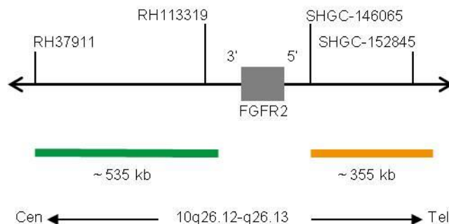
Fig. 1 : Carte de la sonde SPEC FGFR2 (pas à l'échelle)

* selon Human Genome Assembly GRCh37/hg19