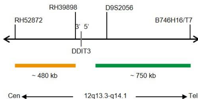
Abb. 1: SPEC DDIT3 Sondenlokalisierung (nicht maßstabgetreu)

Die ZytoLight SPEC DDIT3 Dual Color Break Apart Probe ist verfügbar in zwei Größen: